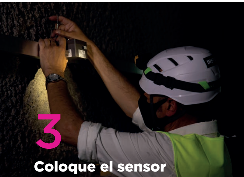
3 Coloque el sensor