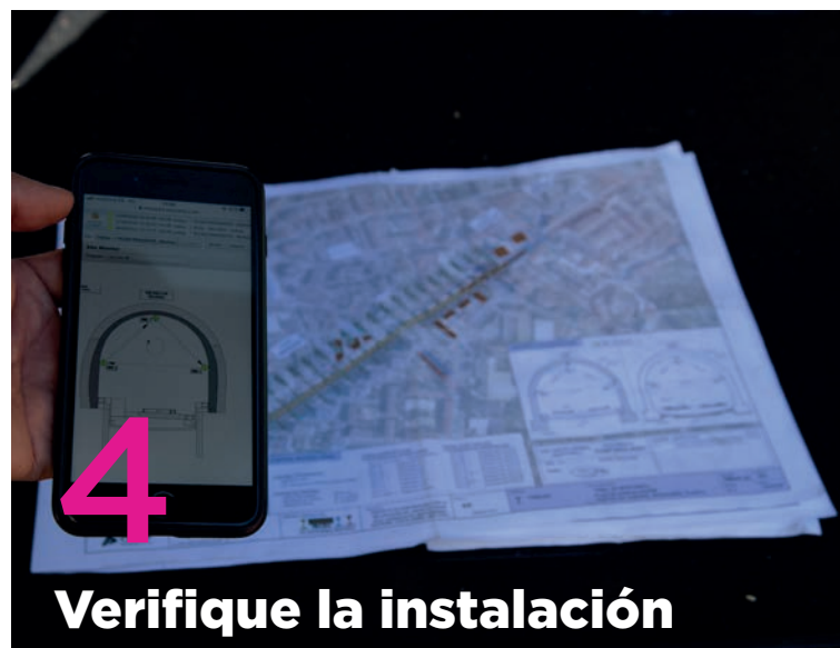
4 Verifique la instalación