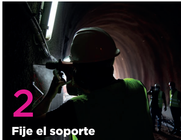
2 Fije el soporte