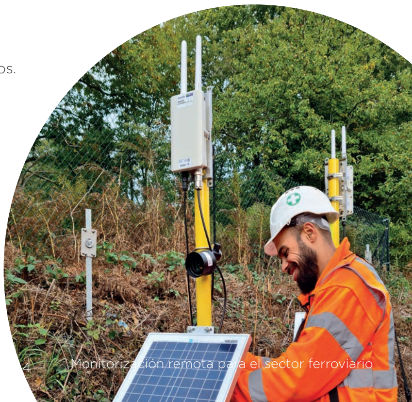
4 Monitorización remota para el sector ferroviario

Los sensores proporcionan datos desde el momento que se han colocado y ofrecen una autonomía superior a 10 años.