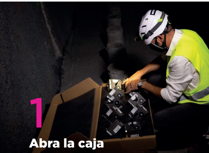
1 Abra la caja